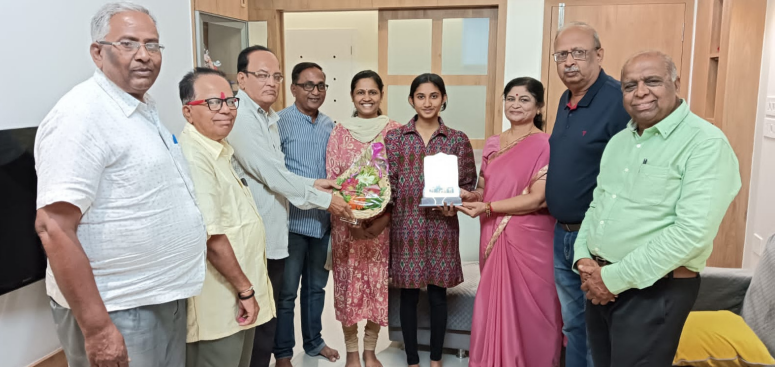
शिरकासार (प्रांतात बाफना)