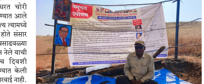
शिवनी येथील गायरान शेतात पाचव्या दिवशीही लक्षवेधी आमरण उपोषण सुरू

बीड प्रतिनिधी जो जमीन सरकारी व जमीन हमारी है शिवनी काठोडा येथील माजी सैनिक देश सेवा करून आल्यानंतर बारा वर्षांपासून सर्व नंबर ६६२ तीला गायरान जमीन कसत आहेत. या ठिकाणची जमीन ही माळराना वर आहे, त्यांनी स्वतःच्या कष्टाने कमवलेल्या पैशातून जेसीबी लावून ही जमीन पिक घेण्यासाठी कष्ट करून वहीतील आणली व त्याच शेतामध्येच त्यांनी राहण्यासाठी एक पत्राचे घर बांधले. त्यामध्ये संसार उपयोगी साहित्य तसेच शेतीला उपयोगी असणारे सर्व अवजारे खत बी बिद्याणे व उपजिविका भागवण्यासाठी लागणारे अन्नधान्य