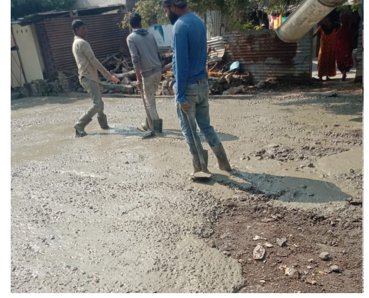
याबाबत जिल्हा परिषद बांधकाम विभाग संबंधित कामाची पाहणी न करताच बिलावर सहा करतात असे संबंधित गुंतदाराचे म्हणणे आहे यामुळे या निकृष्ट दर्जाच्या कामावर वरिष्ठ अधिकारी लक्ष देतील का याबाबत गावकऱ्यातून चर्चा रंगू लागली आहे.

भोगलवाडी (प्रतिनिधी) भोगलवाडी गावामध्ये होत असलेला रस्ता हा निकृष्ट दर्जाचा होत आहे याबाबत संबंधित अधिकारी कसल्याही प्रकारे दखल न घेता सहा करतात यामुळे या गावांमध्ये निकराचेनिकृष्ट काम करण्याची पद्धत बदलत नाही. धारूर तालुक्यातील मोठ्या लोकसंख्येची ग्रामपंचायत असणारी भोगलवाडी येथे या अगोदरही अनेक वेळा कामात भ्रष्टाचार झाल्याचे समजते भोगलवाडी येथे गावातील जिल्हा परिषद शाळेजवळदिनांक २१ नोव्हेंबर मंगळवार रोजी होत असलेला रस्ता अत्यंत होत आहे रस्त्यासाठी खडी ना मुरुम ना दबाई ना करता या रस्त्यावर मातीवरच सिमेंट काँक्रीट टाकून निकृष्ट दर्जाचे काम केले जात आहे.