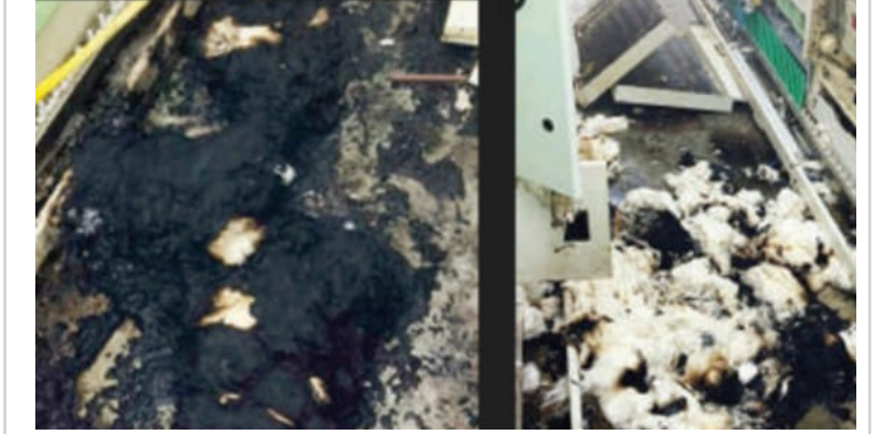
श्री गजानन सहकारी सूतगिरणीला शॉर्टसर्किटमुळे आज अचानक आग लागली या आगीत कापसाच्या गटन पेटल्या होत्या स्थानिक प्रशासनाने अग्निशामक दलाच्या चार गाड्या तातडीने मागवल्यामुळे आग आटोक्यात आली आहे या आगीत नेमके किती नुकसान झाले हे अद्याप कळू शकलेले नाही सूतगिरणीचे कर्मचारी अधिकारी सुरक्षित असून या घटनेत कुठलीही जीवितहानी झालेली नाही