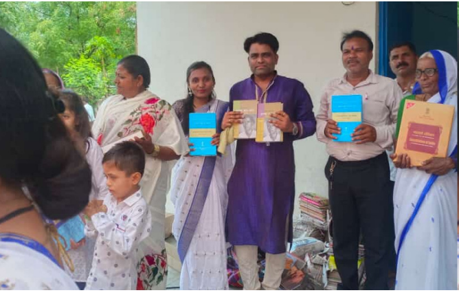
कार्याबद्दल वाचनाची आवड निर्माण व्हावी यासाठी प्रयत्न केला जात आहे. शैक्षणिक क्षेत्रात हुशार असणाऱ्या विद्यार्थ्यांचे बौद्धिक, सामाजिक आणि