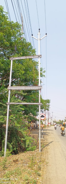
बसविण्यात यावे अशी मागणी जनसामान्यातून व नागरिकांतून होत आहे.