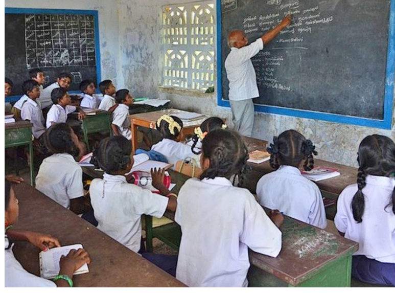
मराठी शाळांवरील शिक्षक आपल्या मुलांना खाजगी इंग्रजी शाळेत शिकवत असतील तर, इतर पालकांनी कोणत्या विश्वासाने आपल्या मुलांना मराठी शाळेत शिकवावे, असा प्रश्न सर्वसामान्य पालकांना पडत आहे.

याला शिक्षण विभागातील वरिष्ठ अधिकारी राजकीय पुढाऱ्यांच्या दावणीला बांधले असल्यामुळे हा सर्व प्रकार घडवून येत असून, अनेक शाळा ग्रेडचा मुख्याध्यापक नाही तर अनेक शाळांमध्ये नियमबाह्य मुख्याध्यापक खुर्चीवर बसल्यामुळे गुणवत्ता ढासळल्याने जिल्हा परिषद शाळांना वाईट दिवस निर्माण झाल्याने पालकांच्या ओंढा जिल्हा परिषद शाळा ऐवजी खाजगी शाळांकडे निर्माण होत आहे. आणि या सर्वांना प्रशासकीय अधिकारी पुढारी व जिल्हा परिषद चे वरिष्ठ अधिकार्यांचा हात असल्यामुळे जिल्हा परिषद शाळांना वाईट दिवस निर्माण झाले आहेत.