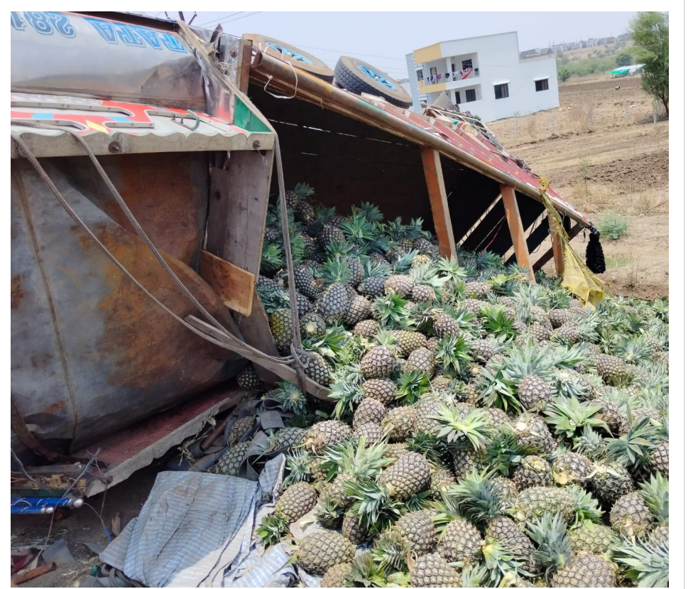
बीड वाय पासवर्ड अननस घेऊन जाणारा ट्रकचा अपघात झाला या अपघातात अपघातात ट्रकचे मोठे नुकसान व आननस रोडवर सर्वत्र पसरले बघायची गर्दी