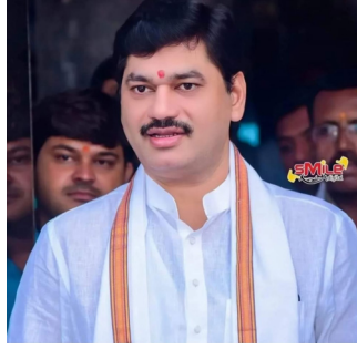
मात्र सोशल मीडियावर अजूनही आमच्यासारख्या नेत्यांचे फोटो आणि बनावट व्हिडिओ पोस्ट करून वातावरण

आता प्रत्येक बीड जिल्हा वासीयांची आहे, असे आवाहन जिल्हाचे पालकमंत्री धनंजय मुंडे यांनी आज व्हीडिओ संदेशाद्वारे केले आहे. क्या हार मे, क्या जीत में, किंचित नही भयभीत मै। स्व. अटल बिहारी वाजपेयी यांच्या या कवितेप्रमाणे मी व पंकजाताईनी अत्यंत जिद्दारी लागणारा हा पराभव मान्य केला आहे. लोकशाहीमध्ये जनतेचा कौल हा महत्त्वाचा असतो आणि तो कौल आपण मान्य करून विजयी उमेदवारास शुभेच्छा देखील दिलेल्या आहेत.