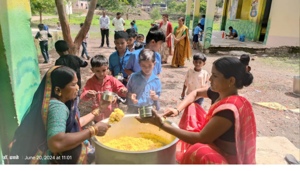
दाखून स्वस्त असणा-या मटकी, हरभरा, वाटाणा, मसूर, मुगडाळ यांचाच शाळांना पुरवठा करण्यात येत आहे. केंद्र शासनाने दिलेल्या सुचनेनुसार विद्यार्थ्यांना दिल्या जाणाऱ्या आहारामध्ये स्थानिक पातळीवर उपलब्ध अन्नधान्य, तृणधान्य व अन्य पदार्थांचा समावेश

तांदळापासून बनविलेल्या पाककृतीच्या स्वरूपात पोषण आहार दिला जात आहे. शालेय पोषण आहार पुरवठादार महाग वस्तुंची कमतरता