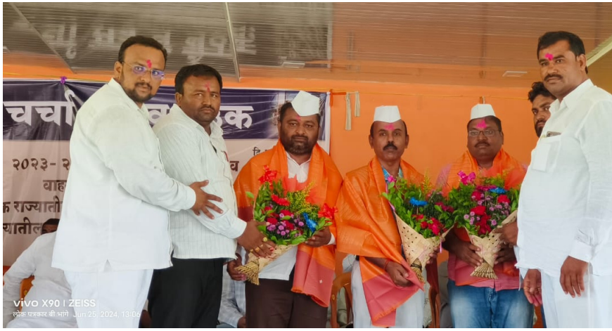
धारूर प्रतिनिधी बीड जिल्हातील मेन मुकादम, व ऊस वाहतूकदार यांच्या वतीने दि.२५ जून २०२४ मंगळवार रोजी सिध्दी मंगल कार्यालय खामगाव पंढरपुर महामार्गावर धारूर-तेलगांव रोड, भोगलवाडी फाटा येथे दुपारी १२ वाजता बैठकीला सुरुवात करण्यात आली. या बैठकीस सर्व कर्नाटकातील कारखान्याचे कर्मचारी अधिकारी प्रतिनिधीत्व करण्यासाठी उपस्थित होते. त्याच प्रमाणे स्व.गोपीनाथरावजी मुंडे साहेब ऊसतोड मजूर संघटनेतील मुकादम

आठ दिवसात राहिलेल्या कारखानदारांनी भाव वाढ न दिल्यास महाराष्ट्रात करारासाठी फिरू देणार नाहीत कर्नाटक राज्यातील अधिकाऱ्यांच्या बैठकीत त्यांना संघटनेचे आवाहन