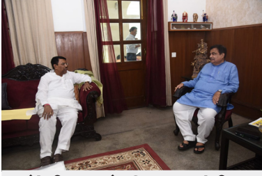
केंद्रीय रस्ते विकास मंत्री नितिन गडकरी यांच्या भेटीत माजीमंत्री जयदत्त क्षीरसागर यांची मागणी

बीड प्रतिनिधी केंद्रीय रस्ते विकास मंत्री नितिन गडकरी यांची नवी दिल्ली येथे नुकतीच भेट घेऊन माजी मंत्री जयदत्त क्षीरसागर यांनी दोन स्लिप रोड यात बीड ते म्हाळस जवळ रस्त्यावर स्लिप रोड व बीड परळी रस्त्यावर स्लिप रोड आणि दोन भुयारी मार्ग यात आनंदवाडी फाटा व समनापूर चौक असे दोन भुयारी मार्ग करण्यात यावेत अशी मागणी केली या मागणीला मंत्रिमहोदयांनी सकारात्मकता दर्शवली असून डीपीआर मिळताच अंतिम मान्यता देऊ असे आश्वासन दिले आहे तर बीड पिंपळनेर मार्गाला राष्ट्रीय मार्गाचा दर्जा देण्याबाबत सरकार विचाराधीन असल्याचे केंद्रीय मंत्री नितिन गडकरी यांनी सांगितले संभाजीनगर ते येडशी महामार्गावर स्लीप रोड व्हावेत यासाठी माजी मंत्री जयदत्त क्षीरसागर यांचा पाठपुरावा सुरू आहे तसेच