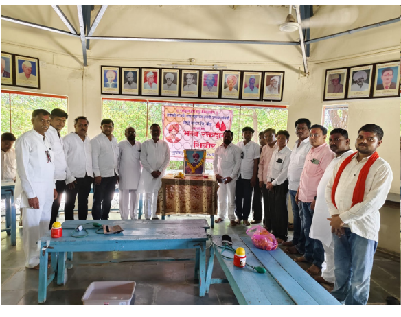
आले.त्या नंतर हुतात्मा स्मारका मध्ये रक्तदान शिबीराचा शुभारंभ करण्यात आला या शिबीराला उत्स्फूर्त प्रतीसाद मिळाला. त्यानंतर