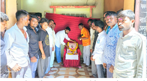
डॉ. बाबासाहेब आंबेडकर यांच्या विधवत्तेचा सन्मान केला. तसेच १८९४ मधील त्यांच्या