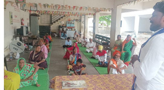
उद्योगधंद्यांना भरभराट आली. नवनवीन पेठा वसविण्यात आल्या. शेती व्यवसायाच्या विकासावर आपली आर्थिक प्रगती आहे हे जाणून शेती व्यवसायास उद्योगीकरणाची जोड दिली, तरच आपली चांगली प्रगती होईल असा विचार ते

राजर्षी शाहू छत्रपती महाराज महाराष्ट्राच्या सामाजिक, शैक्षणिक व सांस्कृतिक क्रांतीचे अग्रदूत आहेत. जातीय विषमते विरुद्ध व उच्चनीचते विरुद्ध बंड पुकारून सामाजिक समता स्थापन करणारा लो क ल्या ण क ा री राजा. महाराष्ट्राच्या सामाजिक चळवळीचे नेतृत्व स्वीकारून पददलित समाजाला जागे करून त्यांच्यामध्ये स्वाभिमानाची ज्योत पेटवण्याचे अत्यंत महत्त्वाचे कार्यही त्यांनीच केले. महाराष्ट्राला मार्गदर्शन करत असतानाच तत्कालीन कोल्हापूर राज्याचा सर्वांगीण विकास या महामानवाने घडविला. राजर्षी शाहू छत्रपती महाराजांच्याच काळात प्राथमिक शिक्षण घराघरात गेले.