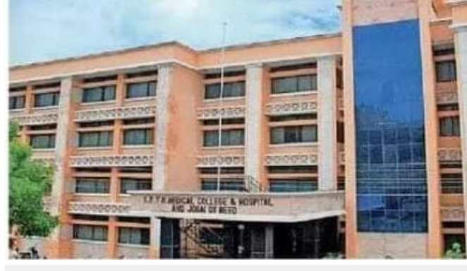
रुग्णांना सुविधा मिळण्याचा मार्ग झाला मोकळा

या संदर्भात महाराष्ट्र शासनाच्या वैद्यकीय शिक्षण व औषधी द्रव्य विभागाच्या मंत्रालयाने २ जुलै २०२४ रोजी आदेश काढले असून या शासन निर्णयात पुढे असे म्हटले आहे की, स्वामी रामानंद तीर्थ वैद्यकीय महाविद्यालय व रुग्णालयाच्या बाल रोग निदान व उपचार विभागात उपचारासाठी येणाऱ्या रुग्णांना अत्याधुनिक उपचारांची सोय व्हावी म्हणून सन २०२४-२०२५ या वित्तीय वर्षात राज्य