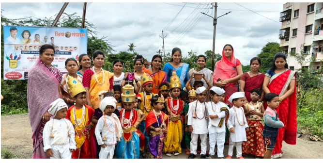
स्वा सावरकर शिशु वाटिकाच्या बालगोपालानी आषाढी एकादशी निमित्त बाल दिंडी काढली होती कुणी विट्टलाच्या तर कुणी रघुमाईच्या रूपात होते