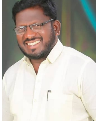
लोकांसाठी सोयी सुविधा केली जातात त्या फक्त थातूरमातूर करून स्वतःचे