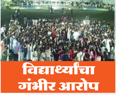
विद्यार्थ्यांचा गंभीर आरोप

* ३०० मुलींचे व्हिडिओ इंटरनेटवर केले लीक ? * प्रकार समोर येताच विद्यार्थ्यांनी महाविद्यालयाचा परिसर दणाणून सोडला.