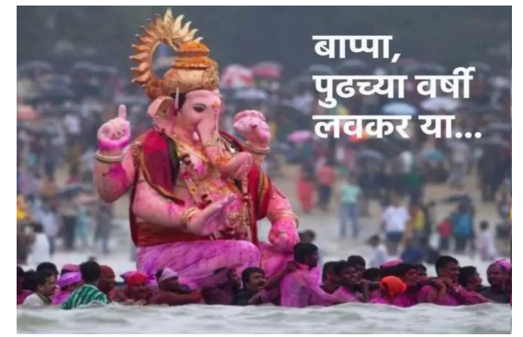
बाप्पा, पुढच्या वर्षी लवकर या...

चतुर्थीला चंद्रदर्शन हे अशुभ धार्मिक शास्त्रांच्या मान्यतेनुसार गणेश चतुर्थीच्या रात्री चंद्राचे दर्शन करू नये. त्या दिवशी जर तुम्ही चंद्र पाहिला तर तुमच्यावर खोटा आरोप ठेवला जाऊ शकतो किंवा तुमच्यासमोर एखादं संकट उभं राहू शकतं. चुकून चंद्र दिसला तर काय करावं? गणेश आगमनाच्या वेळी चुकून जर चंद्र दिसलाच, किंवा अनवधानाने त्याच्याकडे आपण पाहिलंच तर घाबरून जायचं कारण नाही. त्यावरही उपाय सांगितला आहे. चुकून जर चंद्र पाहिला तर भक्ताने गणेशाचे नमन करावं. त्या दिवशी गणपतीच्या मंत्राचा जप करावा किंवा गणेश अथर्वशीर्ष पठण करावं.