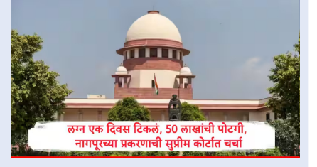
हून एक दिवस टिकले, 50 लाखांची पोटगी, नागपूरच्या प्रकरणाची सुप्रीम कोर्टात चर्चा

नवी दिल्ली : विवाहित महिलांचं शोषण होऊ नये म्हणून भारतात हुंडा प्रथेविरोधात आणि घरगुती हिंसाचाराची प्रकरणे रोखण्यासाठी कायदा करण्यात आलेला आहे. भारतीय दंड संहितेचे कलम ४९८-अ म्हणजे घरगुती हिंसाचार कायदा याच्या वापराबद्दल अनेकदा चर्चा होत असते. या कायद्याचा गैरवापर होत असल्याची काही उदाहरणे देखील समोर आली आहेत. सर्वोच्च न्यायालयात न्यायमूर्ती बीआर गवई, न्यायमूर्ती प्रशांत कुमार मिश्र, न्यायमूर्ती के.वी. विश्वनाथन यांच्या पीठासमोर एका कौटुंबिक प्रकरणाची सुनावणी सुरु होती. न्यायमूर्ती बीआर गवई यांनी पोटगी संदर्भात एक प्रकरण सर्वोच्च न्यायालयासमोर मांडलं. ते म्हणाले अशा प्रकरणांमध्ये स्वातंत्र्य मिळणं महत्त्वाचं असतं.