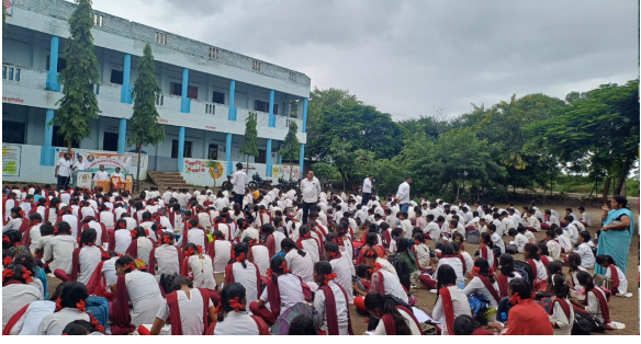
यांच्या मार्गदर्शनाखाली विविध असून शुक्रवार दि.२७ रोजी सामान्यज्ञान स्पर्धेचे आयोजन करण्यात आले