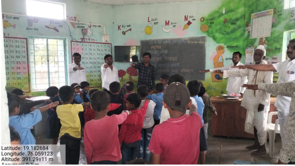
Latitude: 19.182684 Longitude: 76.059123 Altitude: 391.29±11 m