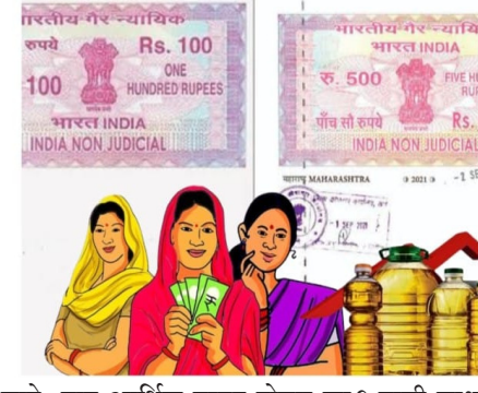
जाते. मात्र आर्थिक तरतुद होणार का? याची शाश्वती कोणालाच नाही. एकीकडे हे सुरू असताना राज्यातील सत्ताधारी मात्र योजना बंद होणार नाही. राखी पौर्णिमेची ओवाळणी दिली. आता बहीणींना भाऊबिजेची

असून कर्जाचा डोंगर वाढत आहे. त्या राज्यात अर्थसंकल्प बाहेर जाऊन पुरवणीच्या जोरावर किती योजना राबवाव्यात याला काही मर्यादा असतात. पुरवणी मागण्या या अचानक उद्भवणाऱ्या तातडीच्या खर्चासाठी करणे समजू शकते. मात्र एकाच योजनेसाठी हजारो कोटींची तरतुद पुरवणी मागणीतून केल्यानंतर राज्याचा आर्थिक गाडा घसरणार होता हे तर निश्चितच. आता तेच पहायला मिळत आहे. लाडकी बहिणी आणि मतांवर डोळा ठेवून आखलेल्या तत्सम योजनांसाठी वेगवेगळ्या ठिकाणाचा निधी वळविला जात आहे. मागच्या काही काळात बांधकाम विभागाचा निधी हडपण्यात आला. तिर्थक्षेत्र, पर्यटन या विभागांना घायला सरकारकडे पैसा नाही. ग्रामविकासची कामे कोणत्याही क्षणी ठप्प पडतील अशी परिस्थिती आहे. वेगवेगळ्या विभागामध्ये सध्या शेकडो, हजारो कोटींच्या कामांना मंजुरी दिली