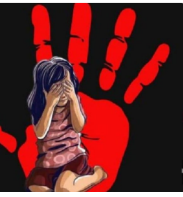
माजलगाव शहरालगत असलेल्या एका शाळेत अंगणवाडी आहे. त्यामध्ये परिसरातील लहान मुले-मुली दररोज अत्याचाराच्या, अत्याचाराच्या घटना घडत वर्षांची चिमुकली नियमित शाळेत येते. तिच्यावर शाळेतील एका अज्ञात इसमाने २७ सप्टेंबर रोजी मधल्या सुटीतील डबा

माजलगाव (प्रतिनिधी) माजलगाव, राज्यात शाळेत शिक्षण घेणाऱ्या शाळकरी मुलींवर अत्याचाराच्या घटनांची मालिका सुरूच असून बीड जिल्हातील माजलगाव येथील एका खासगी शाळेतील अंगणवाडीत साडेपाच वर्षांच्या मुलीवर अत्याचार झाल्याची संतापजनक घटना उघडकीस आली आहे. याप्रकरणी एका अज्ञाताविरुद्ध पोलिसांनी गुन्हा दाखल केला असून पुढील तपाससुरू आहे. राज्यात बदलापूरच्या घटनेने सर्वत्र खळबळ उडाली असून त्यानंतर दररोज कोठे ना कोठे शाळकरी मुलींवर अत्याचाराच्या, अत्याचाराच्या घटना घडत असल्याच्या उघड होत आहेत. त्यामुळे पालक वर्गात अगोदरच भीतीचे वातावरण पसरलेले आहे. बीड जिल्हातील