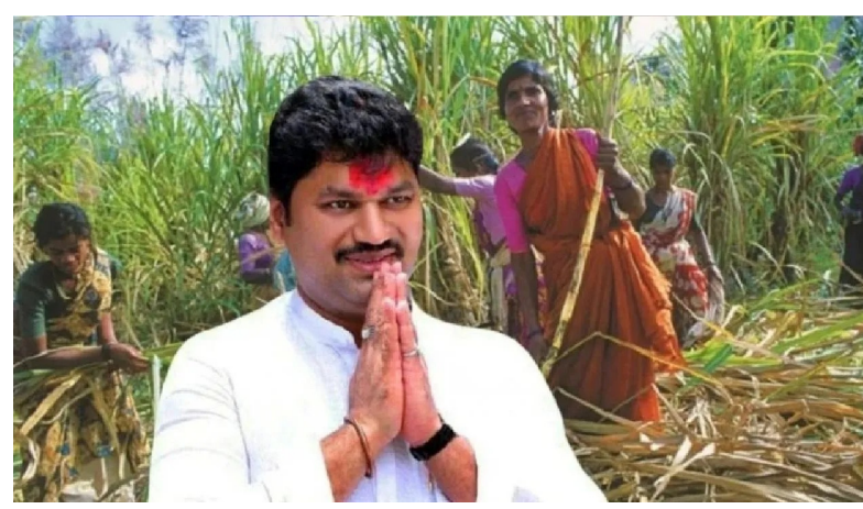
प्रस्तावित केले होते. राज्याचे मुख्यमंत्री व सध्याचे सामाजिक न्याय मंत्री एकनाथराव शिंदे यांनी अर्थ व नियोजन विभागाच्या समन्वयातून या योजनेला मूर्त स्वरूप दिले असून, त्यांचा मी अत्यंत ऋणी आहे. ऊसतोड कामगारांना

संभाजी नगर, परभणी, धाराशिव, लातूर, नांदेड, जालना, धुळे, जळगाव आदी जिल्हातील सुमारे १० लाख ऊसतोड कामगार वेगवेगळ्या जिल्ह्यात तसेच शेजारील राज्यात कमीत कमी ६ महिने स्थलांतर करून उसतोडणीला जातात. ऊन, वारा, पाऊस, थंडी अशा कोणत्याही परिस्थितीत दिवसरात्र अत्यंत मेहनत व जोखमीचे काम त्यांना करावे लागते. ऊसतोडणी व वाहतुकीदरम्यान अनेक अपघात, विजेचा शॉक, सर्पदंश, वाऱ्या-पावसाने नुकसान, रस्ते अपघात यांसारख्या शेकडो समस्यांना तोंड देताना ऊसतोड कामगारांचे अनेकदा जीव जातात, अनेकजण कायमस्वरूपी अपंग होतात व त्यांच्या कुटुंबाचा आधार नाहीसा होतो. त्यामुळे या ऊसतोड कामगारांना, वाहतूक कामगारांना तसेच त्यांच्या पश्नाना स्वतंत्र अपघात विमा योजना असावी, त्याद्वारे मृत्यू झाल्यास आर्थिक मदत, अपंगत्व आल्यास आर्थिक मदत व उपचार अशा निरनिराळ्या तरतुदी असल्यात असे २०२२ मध्ये धनंजय मुंडे यांनी सामाजिक न्याय विभागामार्फत