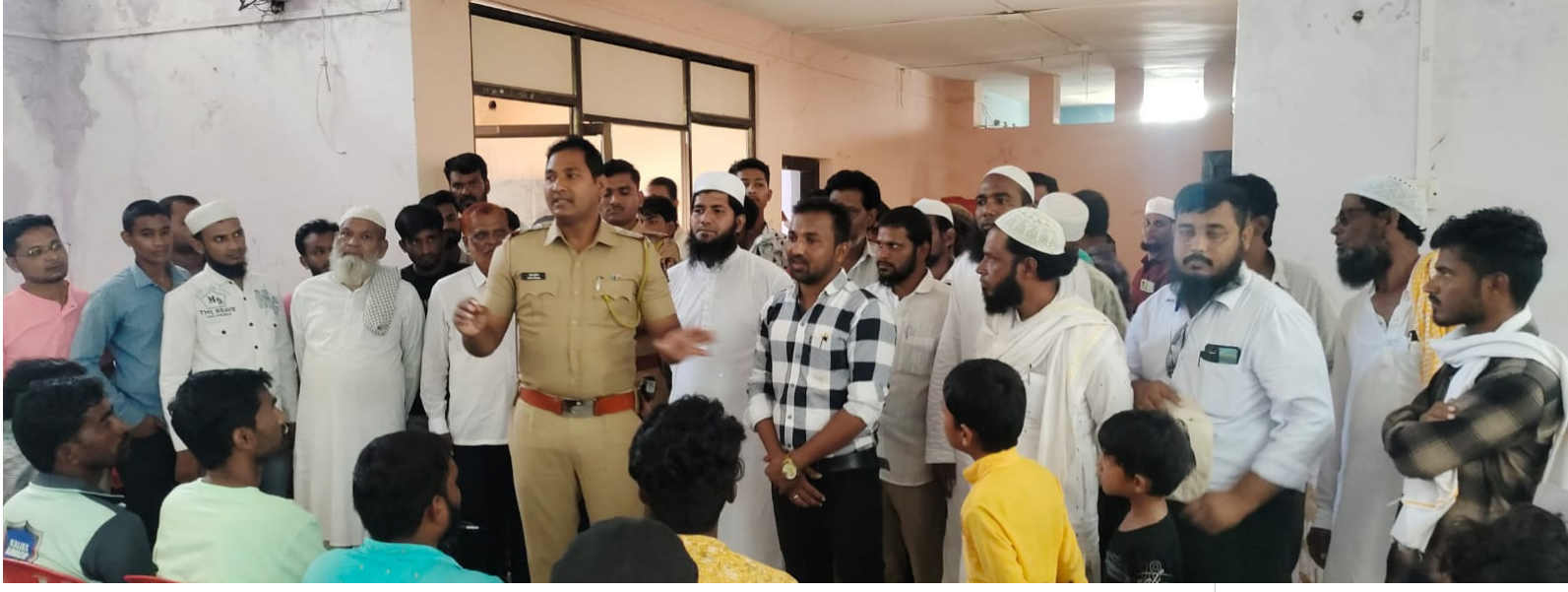
प्रतिनिधी | माजलगाव

ऑक्टोबर ही मतदार यादीत नाव नोंदविण्यासाठी शेवटची तारीख आहे. १९ ऑक्टोबर पर्यंत आपण मतदार होऊ शकता. यासाठी व्होटर हेल्पलाईन हे मोबाईल प, ११११११. शल्ल. सॅ. षप या वेबसाइटवर सुद्धा ऑनलाईन पद्धतीने मतदार नोंदणीचा फॉर्म नमुना ६ भरू शकता किंवा मतदान नोंदणी अधिकारी कार्यालयात जाऊन मतदार होऊ शकता. यासंदर्भात १८००-२२-१९५० या हेल्पलाईनचीही मदत घेऊ शकता. मतदार यादी अंतिम करण्याची प्रक्रिया ही नामनिर्देशन प्रक्रिया पूर्ण होईपर्यंत सुरू असते.