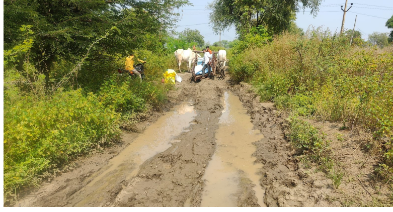
दरवर्षी पावसाळ्यात गुडघाभर चिखलातून ये जा करताना त्रास होतो. पुढारी लोके

सध्या कांदा आणि ज्वारीला खत टाकण्यासाठी लिंबागणेश येथील कृषी दुकानातून घेऊन जात असताना खराब रस्त्यामुळे बैलगाडी चिखलात फसली. गाडीतील खत खाली उतरवून भावाला बोलाऊन चिखलातून गाडी काढली.