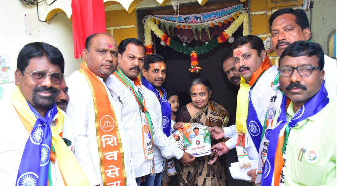
उत्सवात, आमच्या सुख-दुःखात धनंजय मुंडें उपस्थित असतात, अशी अनेक कामे नागरिक यावेळी पदाधिकाऱ्यांना सांगू लागले. धनंजय मुंडें यांच्या नेतृत्वात परळी शहर विकासाच्या पथावर असून याची

परळी । प्रतिनिधी कृषिमंत्री धनंजय मुंडें यांच्या सोबतीला आता परळी शहरातील महायुतीचे सर्व पदाधिकारी व कार्यकर्ते प्रचारासाठी मैदानात उतरले असून आज सकाळच्या सात वाजल्यापासून दिवसभर माहितीच्या पदाधिकाऱ्यांनी परळी शहरातील विविध भागात घरोघर जाऊन नागरिकांच्या भेटी घेत धनंजय मुंडें यांना मतदान करण्याचे आवाहन केले. या प्रचार फेरीस उत्स्फूर्त असा प्रतिसाद परळीकर नागरिकांनी दिल्याचे पाहायला मिळाले.