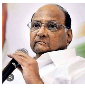
सरकार स्थापन होणार आहे. या दृष्टिकोनातून सर्व कार्यकर्ते ठिकठिकाणी जाहीर सभा घेत आहेत. त्याच अनुषंगाने परळी वेंजनाथ येथे दिनांक नव रोजी