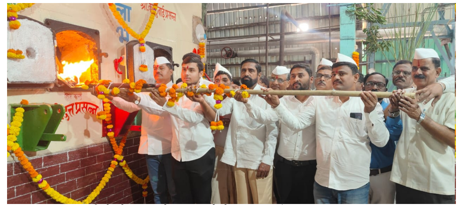
कामगार पगार, ऊस बिले, तोडणी वाहतूक बिले वेळच्या वेळी दिली जात आहेत. उत्कृष्ट व्यवस्थापणातून कारखान्याचे काम देशपाटीवर गाजत आहे.