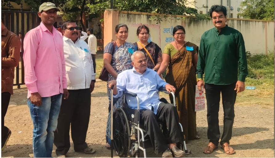
समाज कल्याण विभागाच्या वतीने गेवराईत वयोवृद्ध आणि चालता न येणाऱ्या मतदारांसाठी व्हील चेअरची व्यवस्था करण्यात आली होती.