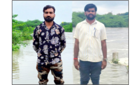
माजलगाव (प्रतिनिधी):- माजलगाव तालुक्यात गेल्या काही दिवसांपासून मुसळधार पावसाचा जोर कायम आहे. सातत्याने होत

असलेल्या या पावसामुळे माजलगाव धरणाची पाणी पातळी झपाट्याने वाढली असून, धरण सुरक्षिततेसाठी प्रशासनाने तब्बल ११ दरवाजे उघडून पाण्याचा विसर्ग सुरू केला आहे. या निर्णयामुळे सिंदफना नदीत मोठ्या प्रमाणावर पाणी सोडले जात असून, नदीकाठच्या गावांना सर्तकतेचा इशारा देण्यात आला आहे.