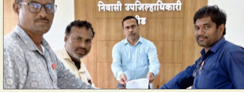
म्हटले आहे त्यांनी पुढे निवेदनात म्हटले आहे की, शेजारील राज्य पंजाब ने शेतकरी ना