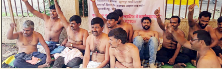
झाल्याशिवाय उठणार नाही, हा त्यांचा ठाम निर्धार प्रशासनाला अडचणीत आणतो आहे. तू कर रडल्यासारखं, मी करतो हाणल्यासारखं

बीड (प्रतिनिधी):- बीड जिल्हाधिकारी कार्यालयासमोर सुरू असलेल्या सुकळी ग्रामस्थांच्या आमरण उपोषणाला आज सहावा दिवस असून आंदोलन आगीसारखे भडकले आहे. पाचव्या दिवशी शुक्रवारी अकरा वाजण्याच्या सुमारास उपोषणकर्त्यांनी अर्धनग्न आंदोलन उभारले. त्या वेळी जिल्हाधिकाऱ्यांनी शिस्त मंडळ बोलावून चर्चा केली; मात्र कोणताही तोडगा न निघाल्याने ग्रामस्थांनी उपोषणावर ठाम भूमिका कायम ठेवली आहे. काम सुरू