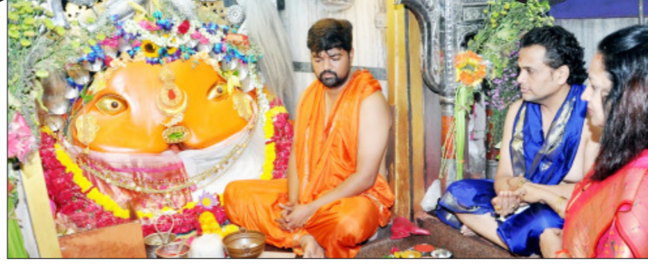
वतीने सर्व सेवा व सुविधा उपलब्ध करून देण्यात आल्या आहेत. विविध उपकरणांची रेलकेल