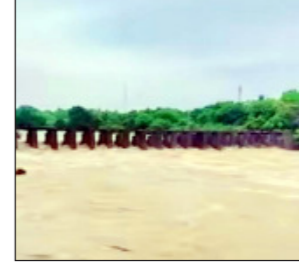
काढले. गोदावरी काठावरील भोजगाव, राजपूर आणि काठोडा या गावाला देखील पुराचा तडाखा बसला आहे. एवढे नाहितर गेवराई तालुक्यातील ग्रामीण भागात पाणीच पाणी झाल्याने जनजीवन विस्कळीत झाले होते. सिंधफणा नदीने पहिल्यांदाच ओलांडली धोक्याची पातळी बीड जिल्ह्यात झालेल्या दोन दिवसांच्या पावसाने सिंधफणा नदीने रुप धारण केले. सद्यस्थितीत सिंधफणा नदीने धोक्याची पातळी ओलांडली असल्याने पहिल्यांदाच

गेवराई (प्रतिनिधी):- शंभर वर्षांत पहिल्यांदाच सिंधफणा नदीने धोक्याची पातळी ओलांडली असून, गोदावरी नदीच्या पात्रात जवळपास एक लाखाहून अधिक पाणी विसर्ग होत असल्याने गेवराई तालुक्यातील दोन्ही नद्यांच्या काठावरील नागरिकांनी सतर्क राहावे असे आवाहन लोकप्रतिनिधी तसे महसूल प्रशासनाकडून करण्यात आले आहे. बीड जिल्ह्यात मागील आठवड्यापासून पाऊस पडत आहे. रविवारी आ. सोमवारी पावसाने कहरच केला. सिंधफणेत पाणी बसले नसल्याने नदीचा प्रवाह बदलला यामुळे गेवराई व बीड तालुक्यातील नदीकाठावरील गावांना पुराचा विळखा पडला होता. इंद्र हवेलीत तर ३२ नागरिक पुरात अडकल्याने प्रशासन सोमवारी रात्री शर्थीचे प्रयत्न करत या नागरिकांना सुखरूप बाहेर