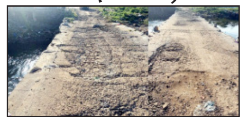
बीड (प्रतिनिधी) - शहरापासून लांब असलेल्या