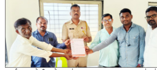
कार्यालय व पोलीस स्टेशन यांना निवेदन सादर करण्यात आले.

के ज (प्रतिनिधी):- त्र्यंबकेश्वर येथे पत्रकारावर स्वामी समर्थ केंद्राजवळील पार्किंगवर दगाडफेक, लाथाबुक्के यांचा वापर करून भयंकर मारहाण करण्यात आली. झालेल्या भ्याड हल्ल्याच्या निषेधार्थ महाराष्ट्र राज्य पत्रकार संघ मुंबई शाखा के ज च्या वतीने तहसील