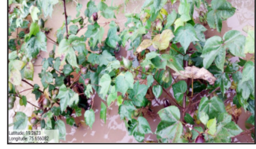
कलेक्टर साहेब, आपली यंत्रणा कोमलवाडी-भोजगावला कधी पाठवणार? असा प्रश्न पान २ वर...

स्थिती प्रशासनाने स्वतःच्या डोळ्यांनी पाहवी. नुकसानग्रस्त शेतकऱ्यांना तात्काळ सर्वे करून मदत द्यावी. शिवाय गोरगरीबांचा संसार पुन्हा उभा करण्यासाठी सरकारने टोस पावले उचलावीत, अशी मागणी शेतकरी करत आहेत. आज गावोगावी संतापाची लाट उसळत असून