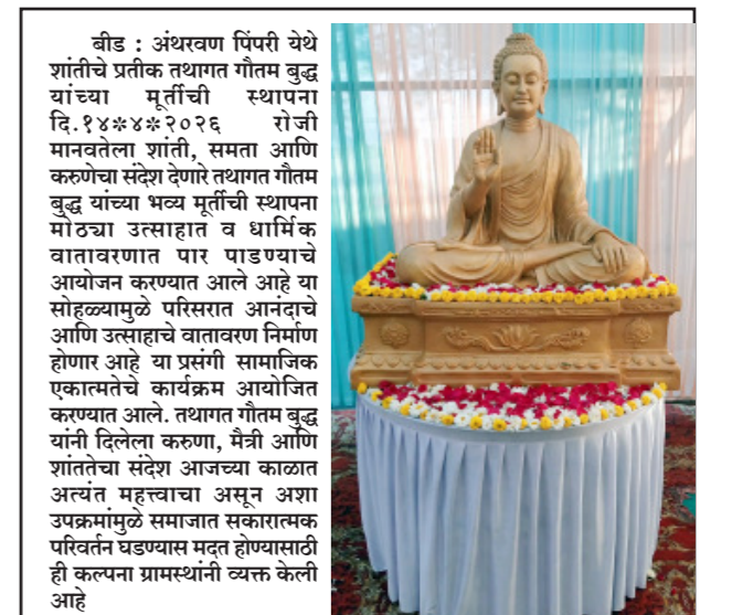
बीड : अंधश्रद्धा विपरीत येथे शांतीचे प्रतीक तथागत गौतम बुध्द यांच्या मूर्तीची स्थापना दि. १४.४.२०२६ रोजी मानवतेला शांती, समता आणि करुणेचा संदेश देणारे तथागत गौतम बुध्द यांच्या भव्य मूर्तीची स्थापना मोठ्या उत्साहात व धार्मिक वातावरणात पार पाडण्याचे आयोजन करण्यात आले आहे या सोहळ्यामुळे परिसरात आनंदाचे आणि उत्साहाचे वातावरण निर्माण होणार आहे या प्रसंगी सामाजिक एकामतेचे कार्यक्रम आयोजित करण्यात आले. तथागत गौतम बुध्द यांनी दिलेला करुणा, मैत्री आणि शांततेचा संदेश आजच्या काळात अत्यंत महत्त्वाचा असून अशा उपक्रमांमुळे समाजात सकारात्मक परिवर्तन घडवण्यास मदत होण्यासाठी ही कल्पना ग्रामस्थांनी व्यक्त केली आहे